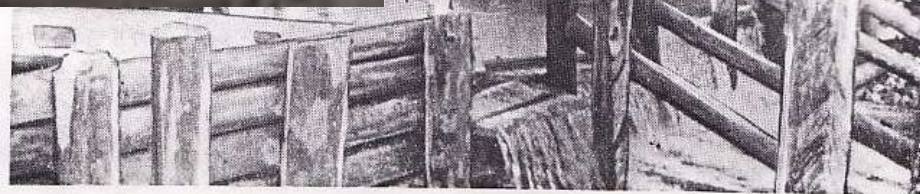
На снимке строительство запруды и пожарного водоема в колхозе «Борьба» осуществляется силами колхозников при активном участии членов ДПД в период подготовки к общественному смотру.